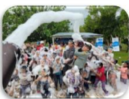
01 Apoyo jornada acción integral Ejercito Nacional – Corregimiento Puerto Santander.