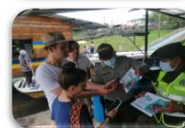
28 Programa Contigo Turismo Seguro.

se realizaron los programas a las comunidades indígenas de San Martín de Amacayacu y Mocagua con la finalidad de promover estrategias que permitan coadyuvar a la reactivación del turismo en estos sectores respetando lo Derechos Humanos de las Comunidades Indígenas del Amazonas.