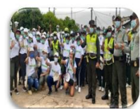
16 Programa Colombia Limpia del Viceministerio de Turismo.