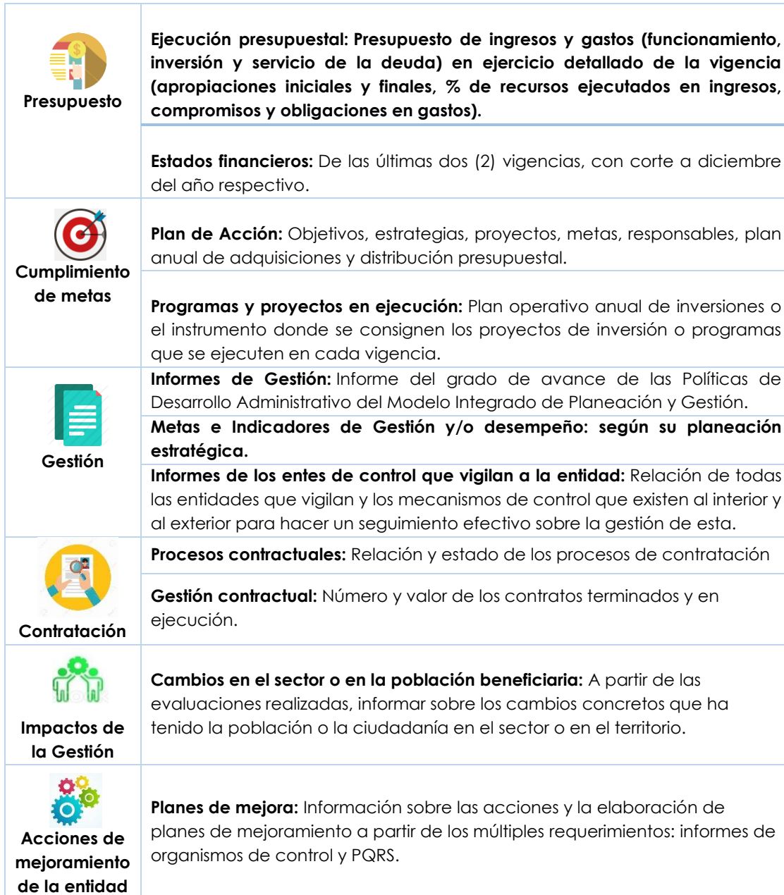
Tabla 1. Temas de la Audiencia Pública de Rendición de Cuentas vigencia 2023