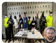
Operación "Onuris" 6 capturas entre ellas alias "Omar o Miguel" segundo cabecilla "La Terraza"