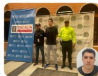
Operación "Apolo 2" Captura de alias Mazo Segundo cabecilla GDCO "Pachelly"