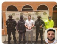
Operación "Ares II" Captura alias "Confile" coordinador de narcotráfico GDCO "Caicedo"