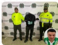
Operación "Apolo" Captura de alias Vargas cabecilla GDCO "Pachelly"