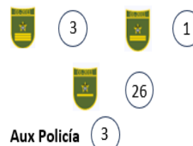
Tabla 1. Temas de la Audiencia Pública de Rendición de Cuentas vigencia 2023