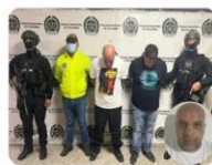
Operación "Fénix" Captura de alias "Bemba", Segundo Cabecilla GDCO "El Mesa"